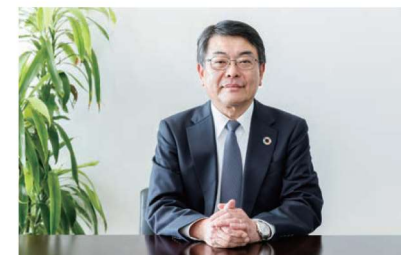
千代田エクスワンエンジニアリング株式会社 代表取締役社長