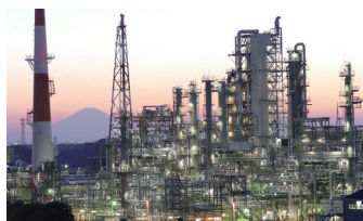
富士石油株式会社 袖ヶ浦製油所