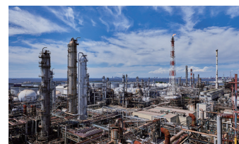
丸善石油化学株式会社 千葉工場