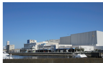
ライオン株式会社 千葉工場