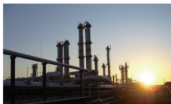
株式会社ENEOSマテリアル 千葉工場