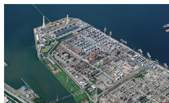
コスモ石油株式会社 千葉製油所