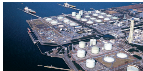
東京ガス株式会社 袖ヶ浦LNG基地 設計・施工：千代田化工建設株式会社

複数の機械や装置が配管で組み合わせたり、複雑な工程や化学反応を通じてエネルギーやさまざまな素材・製品を生産する設備のことです。