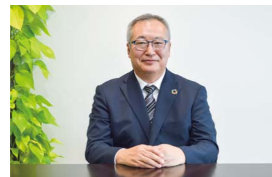
千代田エクスワンエンジニアリング株式会社 代表取締役社長